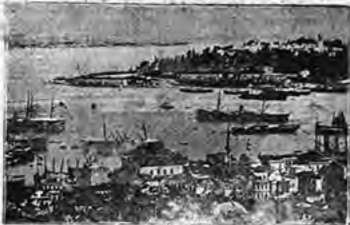
ΤΟ ΑΚΡΟΝ ΤΟΥ ΣΕΡΑΪΟΥ ΕΝ ΚΩΡΥΜΒΟΙ