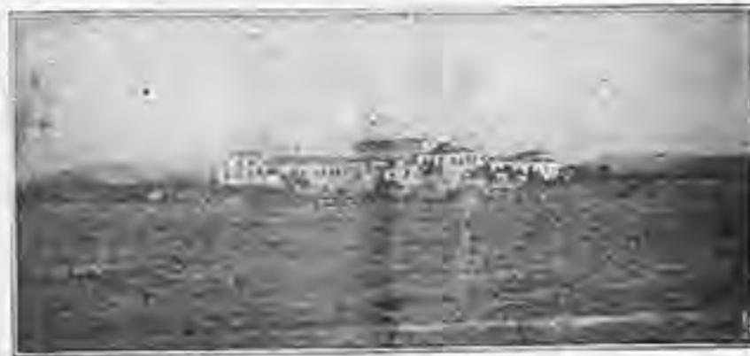
Άποψις νηίδος ΑΓΙΟΥ ΙΩΑΝΝΟΥ - Άντικειμ Μισσηνησίων

ΚΑΝΟΝΙΣΜΟΙ ΚΑΙ ΟΡΟΙ ΠΩΣΗΣ ΤΩΝ ΕΛΑΙΩΝ ΕΛΑΙΟΚΑΡΠΟΥ ΤΗΣ ΕΛΛΑΔΟΣ