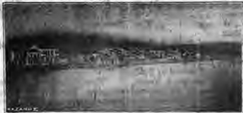
Άπομυε παραθαλασσία του μαγευτικού ΚΟΡΑΒΕΛΙΟΥ Προαστίου τής Σμύρνης Είχον ληφθείσα δά τόν «Αιολικός Άσπης»

— Μωρέ τ'ο περ'ο χρειζούμενο πράμα που ποτέ δέν τ'ο χωρίσθηκε έξαμα σήμερα νά πάρω.